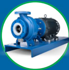
SERIE UC BOMBAS DE ACOPLÉ MAGNÉTICO DE DIMENSIONES ANSI