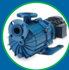
SERIES DB Y SP BOMBAS CENTRÍFUGAS PREMIUM DE ACOPLÉ MAGNÉTICO SIN SELLO