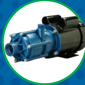
SERIE MSKC BOMBAS CENTRÍFUGAS MULTI-ETAPA DE ACOPLÉ MAGNÉTICO SIN SELLO