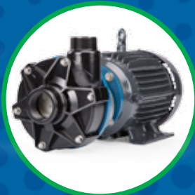
SERIE GP BOMBAS CENTRÍFUGAS DE SELLADO PLÁSTICO