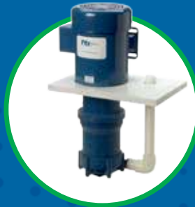
SERIE VKC BOMBAS CENTRÍFUGAS VERTICALES DE ACOPLÉ MAGNÉTICO SIN SELLO