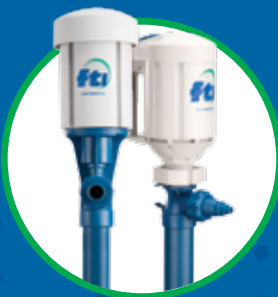
BOMBA VACIADO DE TAMBORES DE FLUIDOS EN TAMBOR/ BARRIL